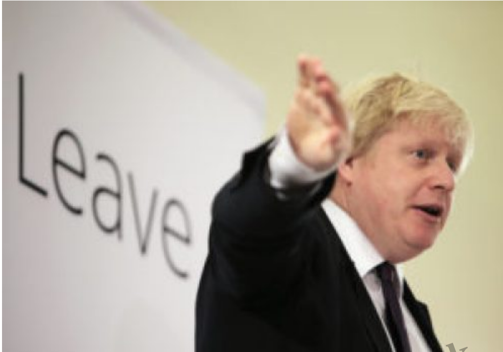
Boris Johnson

Rispetto alle elezioni generali del 2015 il consenso per i Tories è cresciuto progressivamente del 6,7% permettendo di raggiungere il 43,6% dei voti che hanno assicurato al partito 365 seggi su 650 alla Camera dei Comuni; si tratta del più importante risultato elettorale conseguito dopo lo storico trionfo di Margaret Thatcher nel 1987.