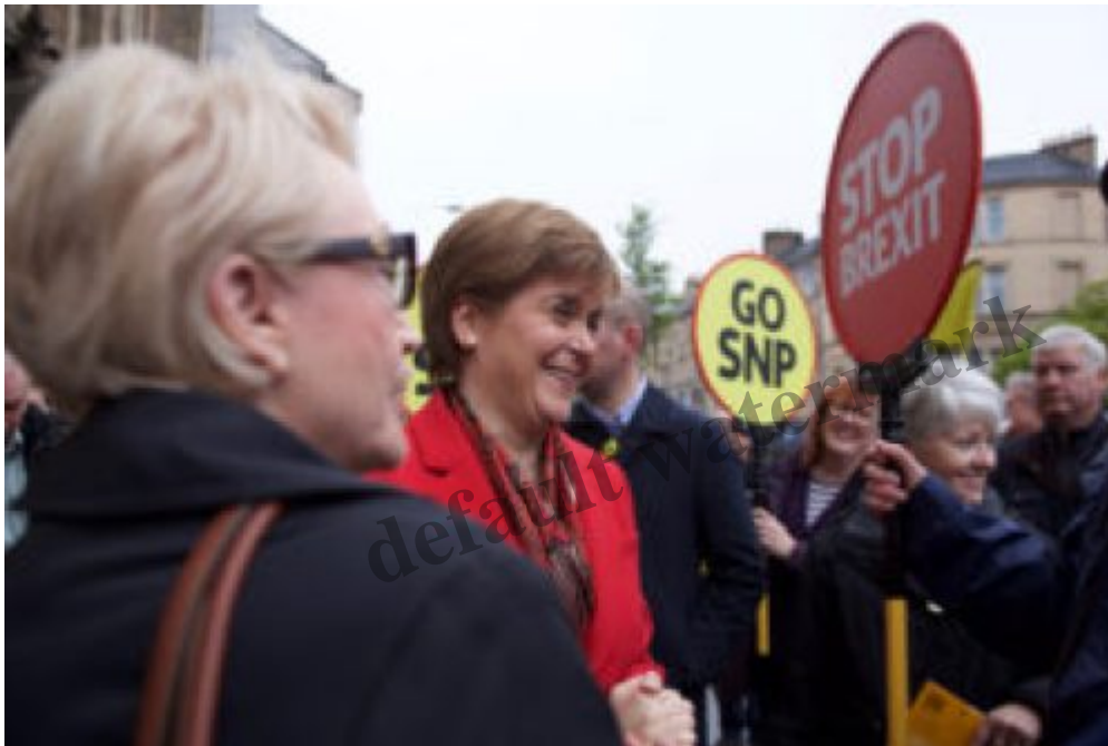
Nicola Sturgeon, leader dello Scottish National Party

Nel 2014 il referendum sullâ€™indipendenza aveva avuto un esito negativo, tuttavia la Brexit ha portato ad un cambiamento delle circostanze e la Scozia ha dovuto affrontare lâ€™esclusione dallâ€™UE seppure il 62% avesse votato per il Remain . Adesso lâ€™obiettivo del SNP Ã puntare allâ€™indipendenza della Scozia per poi rientrare nuovamente nellâ€™UE come stato membro indipendente.