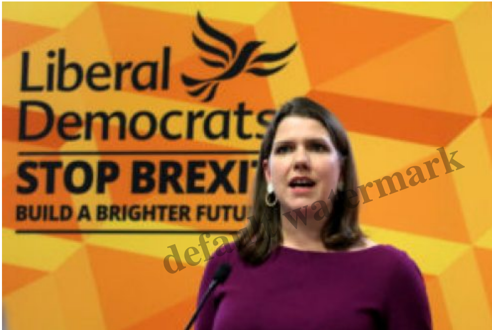
Jo Swinson, leader dimissionaria dei Liberal Democratici

Il quadro Ã chiaro e dimostra ancora una volta la mutazione genetica dell'âeletturato: chi sfugged al pensiero unico, chi Ã a disagio, chi ha istanze di cambiamento vota ormai, e non solo in Inghilterra, per i Conservatori. Un paradosso che deve far ripensare le classiche categorie della politica. La rivoluzione ha cambiato colore, per cosÃ dire. Una rivoluzione fatta di pensiero libero e di idiosincrasia per i dogmi dell'âeurismo, di lotta ai monopoli ed ai lacci nazionali e sovranazionali, di riscoperta della politica vera e legata al potere di decidere. Questo solo per essere chiari rispetto a chianalizza il voto con il âtuttocittÃ beandosi del fatto che i propri beniamini hanno in realtÃ vinto ipresunti luoghi piÃ1 evoluti. C'Ã stata in realtÃ una grande lezione democratica a tutti coloro che guardano al futuro attraverso gli angusti spazi del comma di un trattato votato solo alla stabilitÃ e non alla crescita.